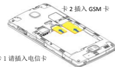
卡 1 请插入电信卡